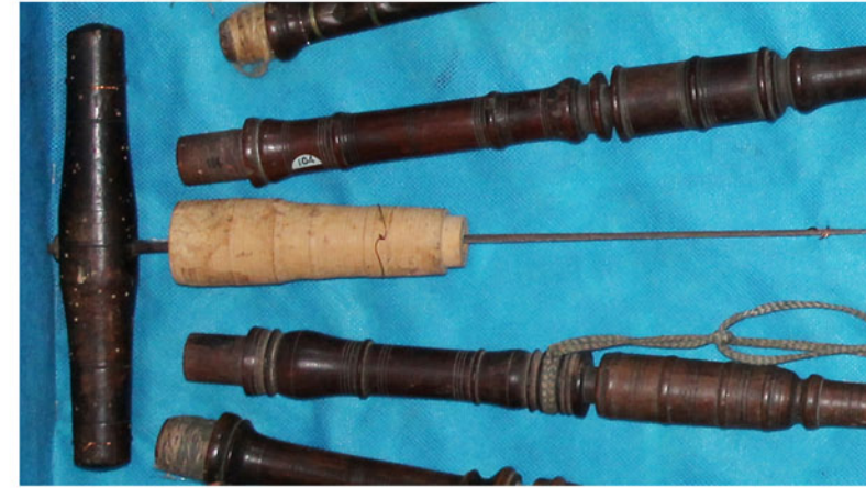
sotto: il grafico dell'alesatore per le Muse